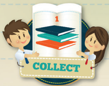
poster interaktif >>